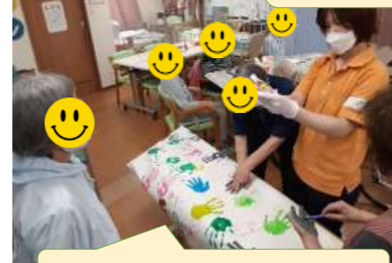
好きな色を選んでもらいました