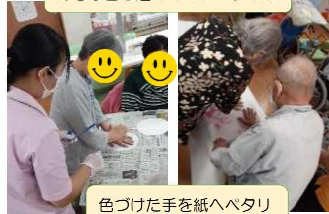
色づけた手を紙へペタリ